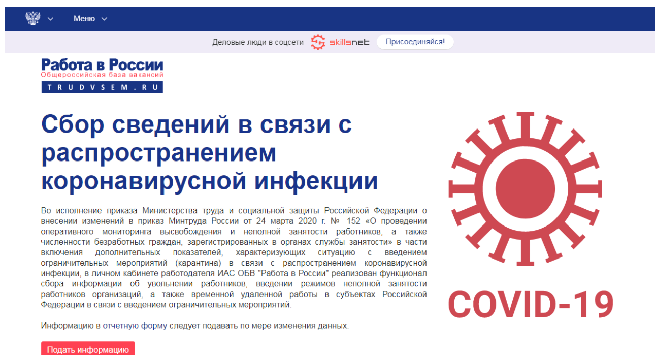
Рис. 2. Информационная страница